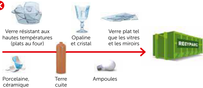
Verre résistant aux hautes températures (plats au four)