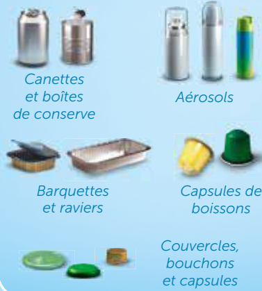
Canettes et boîtes de conserve